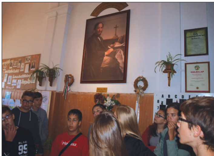
Szacsvy Imre Általános Iskola Nagyvárad

Reggel nyolckor, miután kidörzsöltük szemünkből az álmat, sietve indultunk tovább. Napunk sűrű programjaink közt szerepelt „Kincses Kolozsvár” megcsodálása, ahol mindenki buzgón fotózta a Mátyás-szobrot, érdeklődve tekintettük meg Bocskai István szülőházát, és szemléltük a város építészeti remekeit. Megnéztük a néhai fejedelemség egyik fővárosának egyetemét és egyéb fontos intézményeit is. A Tordai-hasadékban egy érdekes túrát tettünk, ami nagyon fárasztó volt, de a látvány kárpótolt mindenkit. A hasadék keletkezésének legendáját is megismertük. Ezt követően lementünk a Tordai Sóbányába, ahol rengeteg lépcsőt kellett megtennünk ahhoz, hogy lejussunk. Mondjuk azért a látványért, ami ott fogadott minket, azt gondoltuk egyöntetűen: megérte! Torockón megcsodáltuk a Néprajzi Múzeumot, ami felettébb érde-