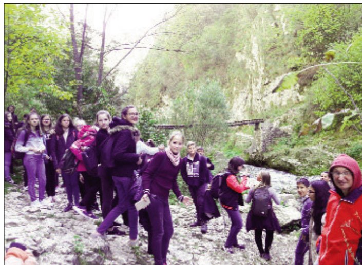
Túra a Tordai-hasadékban