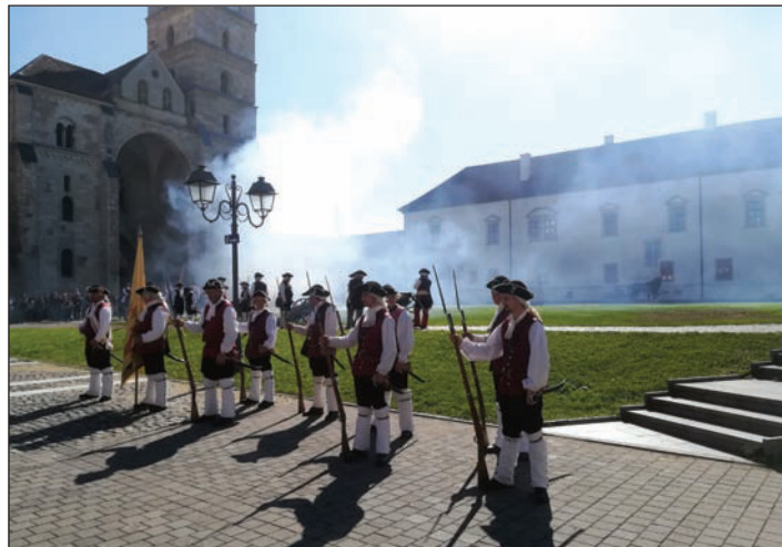
Gyulafehérvár – őrségváltás